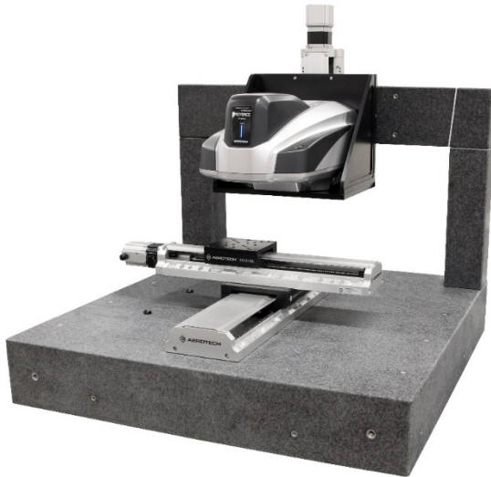
Bild2: Aerotech-Lösung für Keyence VR5000 ((BU)) Integration von Keyence in Aerotech-Positioniersysteme für noch größere Verfahrwege: Die Experten von Aerotech haben hierfür auf einem stabilen Granitportal eine Z-Achse mit bis zu 300 mm Verstellweg montiert. Der Messkopf wird von einem Adapterwinkel getragen. Für die Bauteil-Justage ist ein Kreuztisch auf einer Granitbasis montiert.

Downloadlink: http://www.pr-x.de/fileadmin/download/pictures/Aerotech/Aerotech/Norbert-Ludwig_GF_Aerotech.jpg